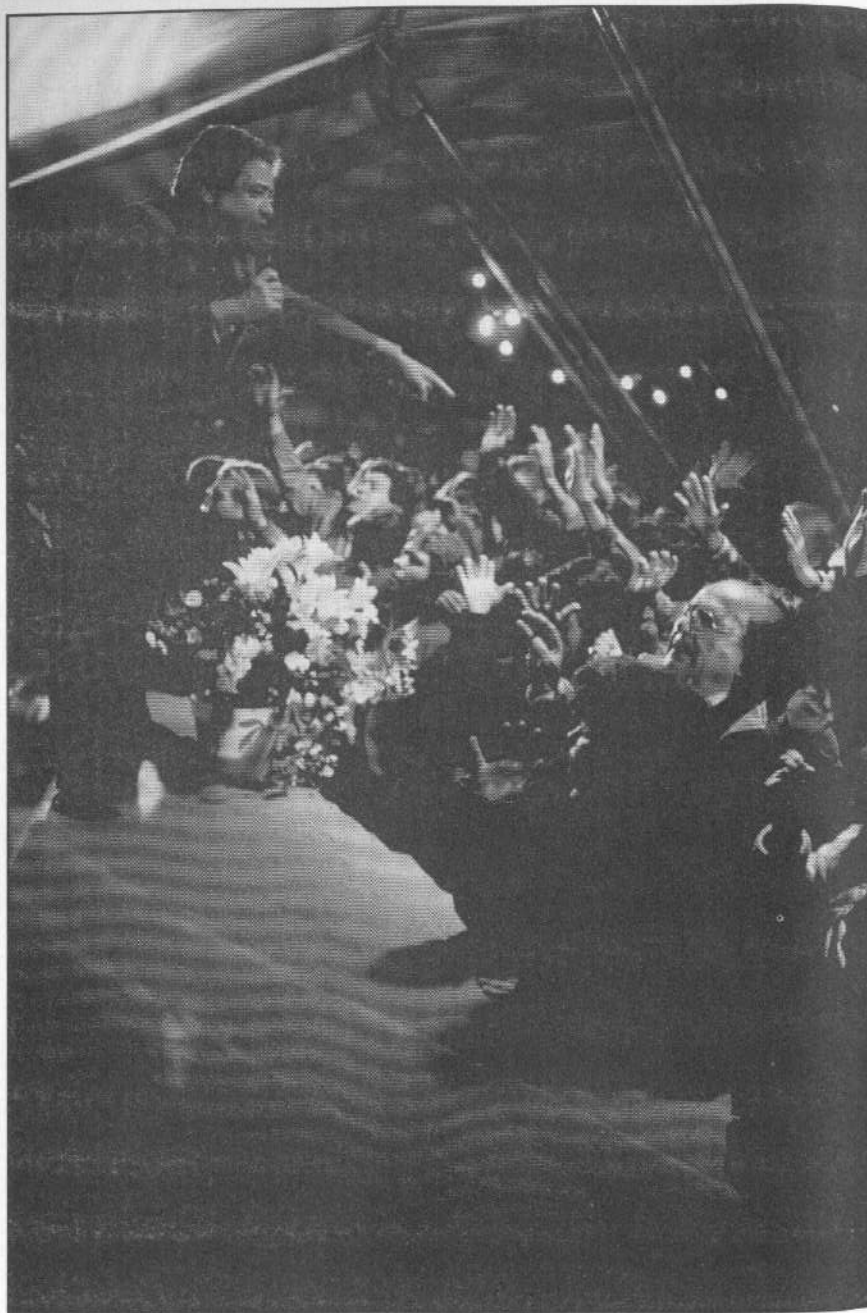
Noche a noche el evangelista confronta las fuerzas del enemigo con total autoridad.