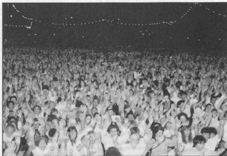
Miles de personas acuden a las campañas, hambrientas del poder sobrenatural que cambiará sus vidas.