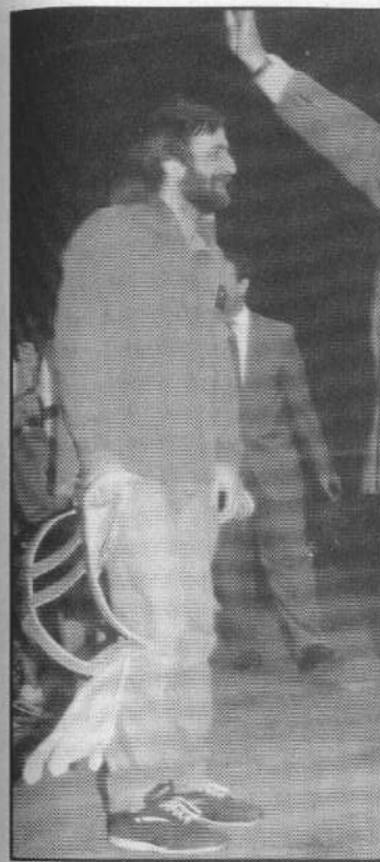
Asombrosos milagros de sanidad son registrados por el equipo evangelístico «Mensaje de Salvación» luego de cada reunión.