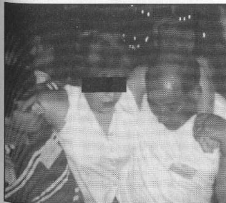
¡Oírme bien, Satanás!... luego de la confrontación espiritual, decenas de personas son trasladadas a la carpa de liberación para recibir ministración.