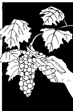
Mucho fruto ---¡Límpiese!

El plan de Dios para nosotros consiste en que produzcamos mucho fruto. El envía su Santo Espíritu para justificarnos, para vivir en nosotros y santificarnos en el nombre del Señor Jesucristo (1 Corintios 6:11). Ser santificado significa estar separado del pecado y ser apartado para Dios , conformado a la imagen de Cristo (Romanos 8:29). “Todo aquel que lleva fruto, lo limpiará” se refiere a la santificación como se declara en 2 Tesalonicenses 2:13: “Dios os haya escogido desde el principio para salvación, mediante la santificación por el Espíritu y la fe en la verdad.”