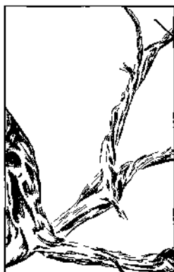
Sin fruto --- ¡Córtese!